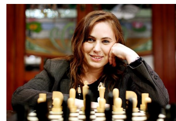
Imagen aparecida en el Times.

blancas siempre juega 1.e4 (aunque alguna vez encontraréis en sus partidas 1.d4, estrategia que sigue cuando desea sorprender a su rival).