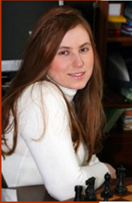
Polgár Judit (Budapest, 1976).

“En sus primeros torneos Judit siempre iba acompañada por su madre.”